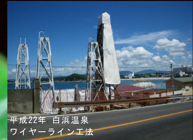
平成22年 白浜温泉 ワイヤーライン工法