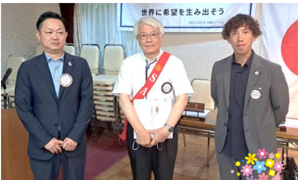
8 月会員誕生日 おめでとうございます♪