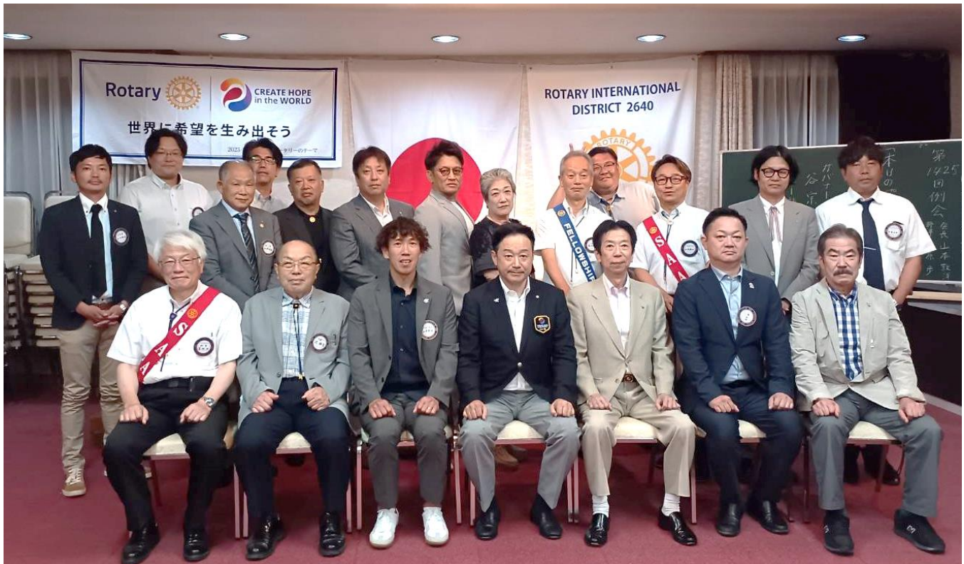
谷ガバナーを囲んで記念撮影