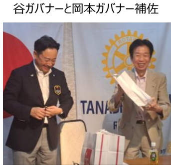
谷ガバナーと岡本ガバナー補佐