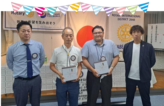
9月結婚記念日 おめでとうございます♪