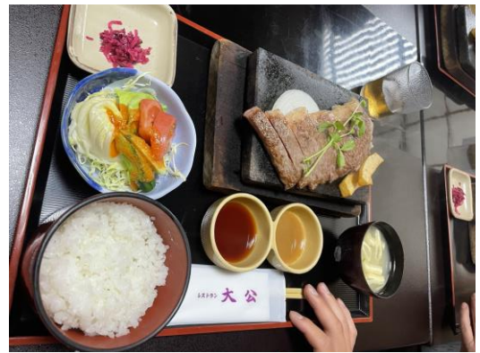
片山祐弥君に山本会長より 淡路牛サーロイン200g 11,000円!!